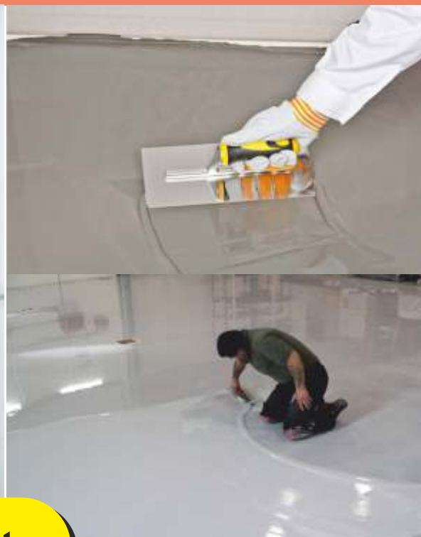
Autolivellante da colata