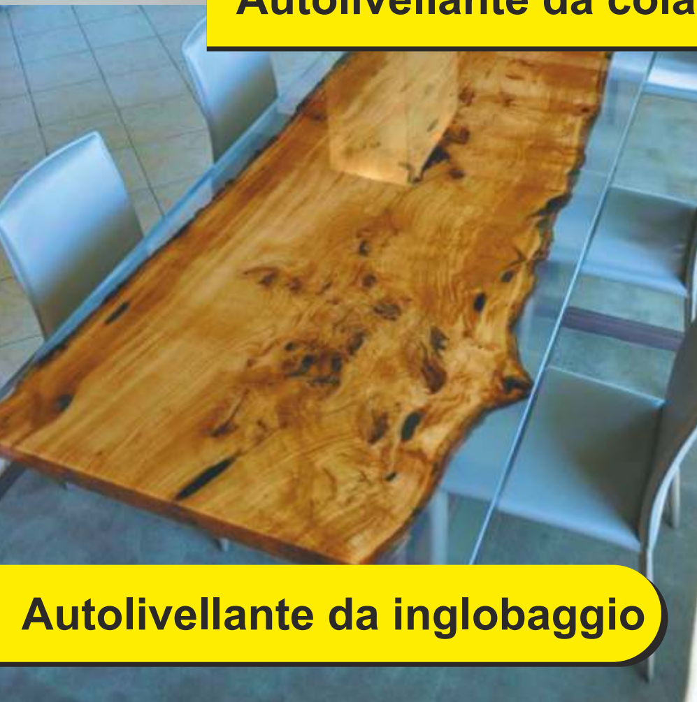
Autolivellante da inglobaggio